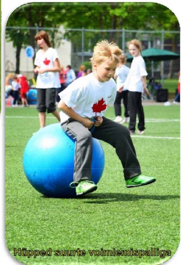
Hüpped suurte voimlemispalliga